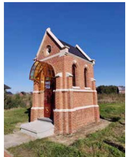
Een nieuwe toekomst voor de kapel.

Binnenkort kan u de foto's terugvinden op onze Facebookpagina: www.facebook.com/nva.rijkevorsel .