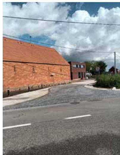
Samen werken we aan Rijkevorsel.

De renovatie van de Sint-Jozefkapel is voltooid en het resultaat mag gezien worden. De kapel werd in 1912 gebouwd op het terrein van de toen pas opgerichte steenfabriek SAS. Nu is ze klaar voor de toekomst bij het nieuwe woon- en parkproject dat binnenkort op het terrein zal verschijnen.